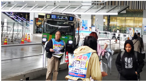
雨の中、渋谷駅ハチ公口から屋根のある宮益坂口のバスターミナル前に移動して署名街宣