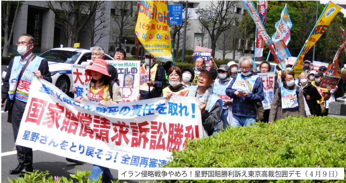
イラン侵略戦争やめろ! 星野国賠勝利訴え東京高裁包囲デモ (4月9日)

◇頒価 200 円 ◇毎月 1 回 第 1 月曜日発行 ◇会費 年間 3000 円 ◇振替口座 (ゆうちょ銀行) 00140-7-635858 (星野・大坂全国救援会)