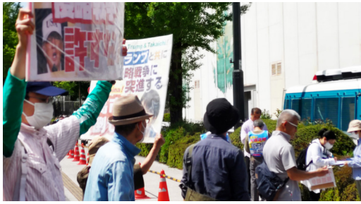
国会前に集まる労働者に大坂解放署名を訴え (4月19日 財務省上交差点)

4月8日と19日、「イラン戦争反対、改憲阻止、高市政権打倒」の国会行動が闘われ、それぞれ数万人の労働者民衆が結集しました。この日、私たち救援会は改憲・戦争阻止！ 大行進の仲間と共に行動し、大坂正明さん解放署名を集めました。