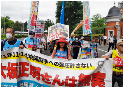
大坂解放求め、直ちに東京高裁包囲デモをうちぬく (5月28日 法務省前)