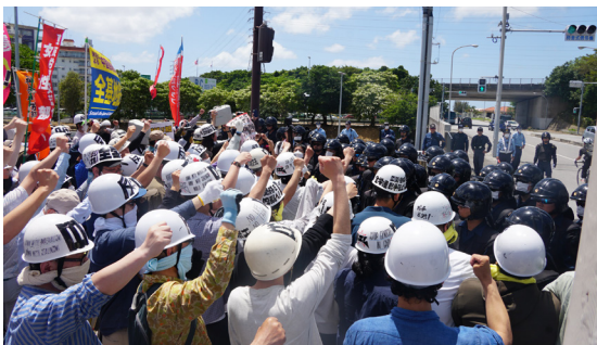
嘉手納第2ゲートを前に機動隊と攻防（5月17日）

2日目は反基地闘争。普天間、嘉手納をめぐり、かつて沖縄の労働者の力で基地撤去の實力闘争が闘いぬかれた地に全軍労をほうふつさせるヘルメット部隊が登場し、闘いの記憶を呼び覚ます力強い集会とデモを、機動隊と激突しながら貫徹しました。