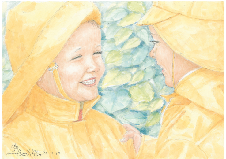
「五月、雨の日、帰る道の会話」