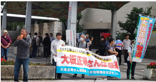
沖縄県庁前に登場し大坂さん解放を訴える（5月16日）

5月16、18日、改憲・戦争阻止！大行進沖縄が主催した「復帰54年5・15沖縄闘争を救援会も闘いました。この3日間の闘いは、沖縄の反基地闘争への激しい誹謗中傷が日本中で吹き荒れる中、「中国侵略戦争を絶対に止める」「イラン侵略戦争の出撃拠点である現実を許さない」と、青年先頭に意気高く激しく闘われ、全基地撤去・日帝打倒の實力闘争として、新たな沖縄闘争の展望を示しました。