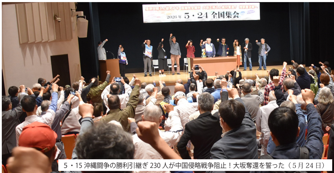
5・15 沖縄闘争の勝利引継ぎ 230人が中国侵略戦争阻止！大坂奪還を誓った（5月24日）

◇頒価 200円 ◇毎月1回 第1月曜日発行 ◇会費 年間3000円 ◇振替口座 (ゆうちょ銀行) 00140-7-635858 (星野・大坂全国救援会) ◇TEL 03-3591-8224 FAX 03-3591-8226 ◇Email : hoshinoosaka@gmail.com ◇ホームページ http://fhoshino.u.cnet-ta.ne.jp/